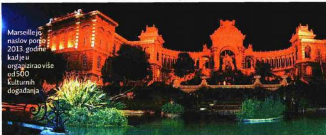
Marseille je naslov pobje 2013. godine kad je u organizirao više od 500 kulturnih događanja