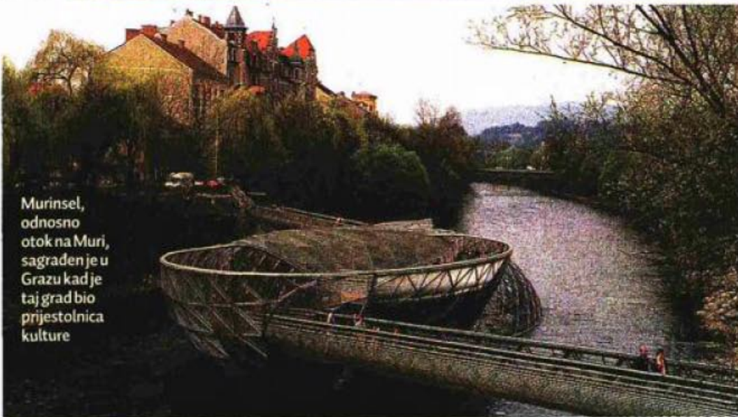
Murinsel, odnosno otok na Muri, sagrađen je u Grazu kad je taj grad bio prijestolnica kulture